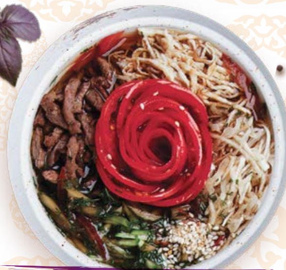
Холодный кукси с лапшой, говядиной и пряными овощами 300г