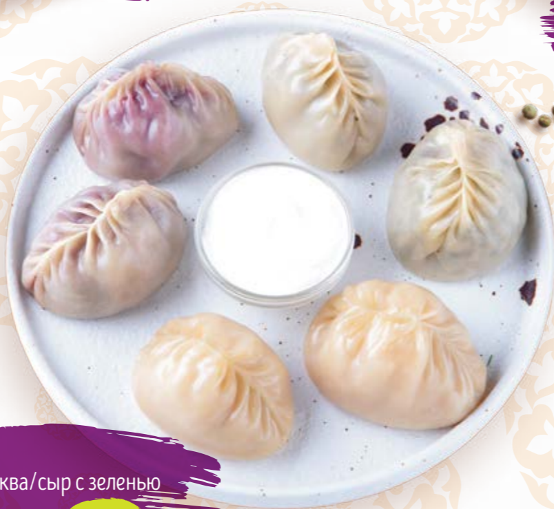
Манты вишня/тыква/сыр с зеленью 1шт. 60г