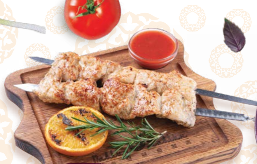
Сочный шашлык из индейки, маринованный в соусе Цезарь 210г