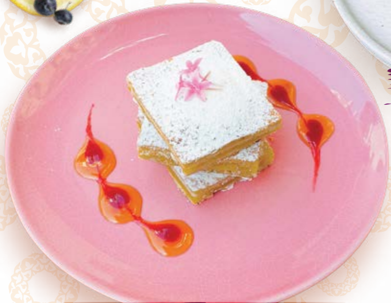
Лимонный пирог 160г 320P