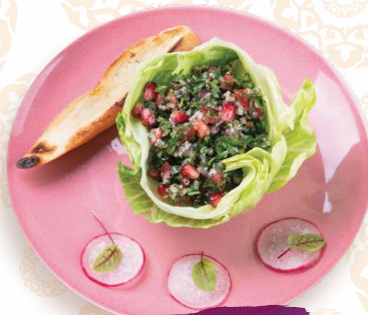
Ливанский салат с сочной зеленью, киноа и зернами граната 175г 390P