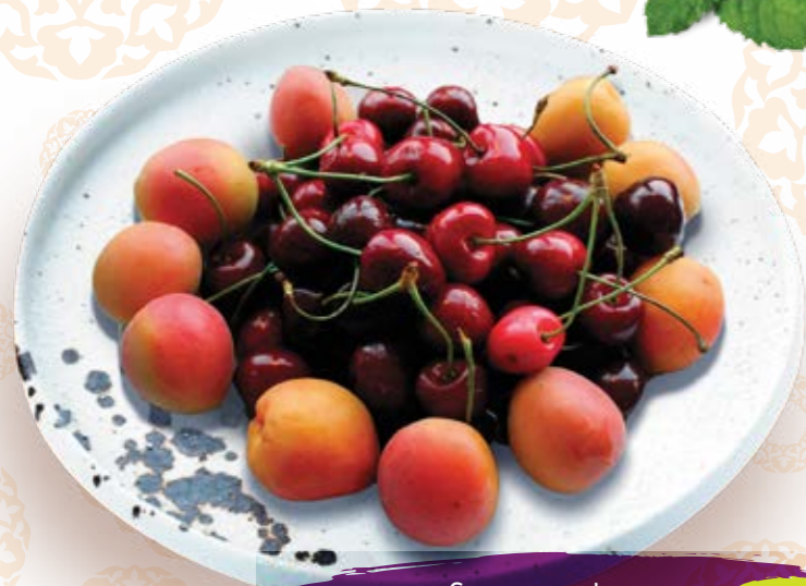
Сезонные фрукты за 100г 125P