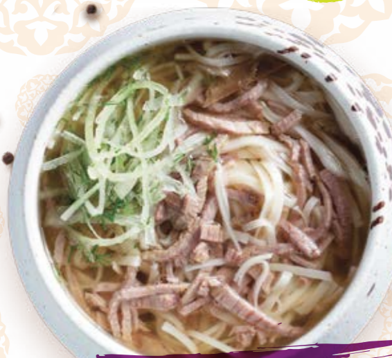
Норын с рубленой кониной и крепчайшим бульоном, который особенно вдохновляет мужчин 300г