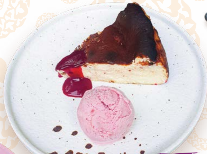
Чизкейк Сан Себастьян с клубничным мороженым 200г 390P