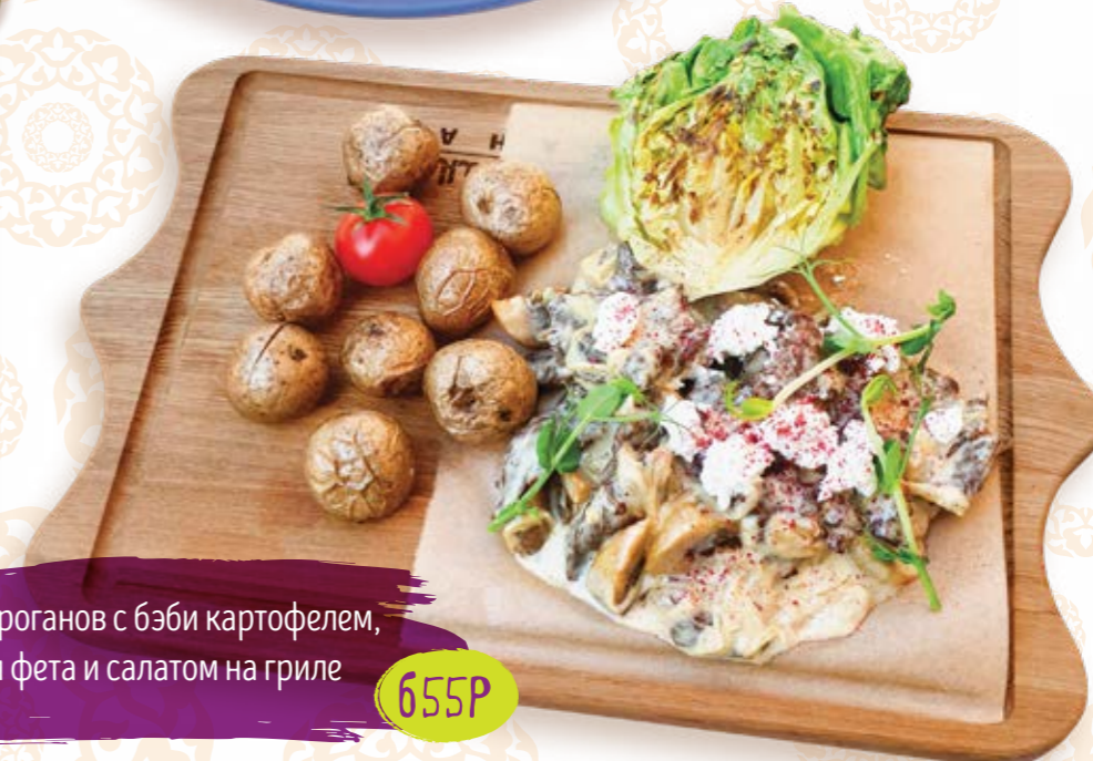
Бефстроганов с бэби картофелем, сыром фета и салатом на гриле 300г