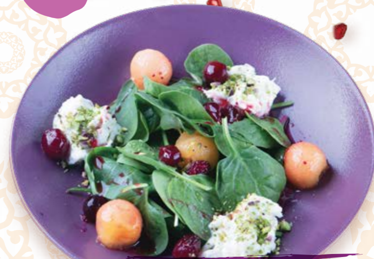
Молодой шпинат со страчателлой и дыней 150г 480P