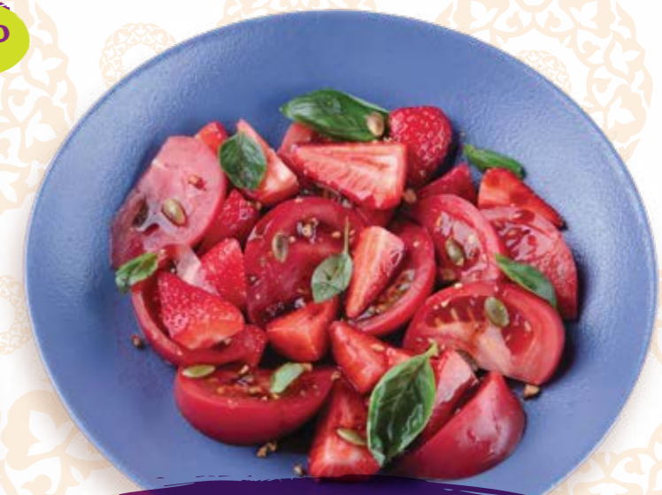
Ароматные помидоры, клубника с карамелизированными орешками и пряным соусом 200г 395P

Данный буклет является информационным материалом. Меню с описанием состава, выхода и стоимости находится у менеджера.