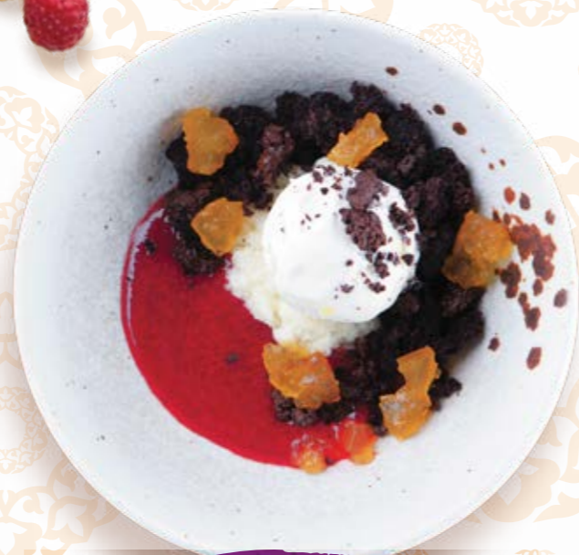
Кокосовое пралине, мармелад из маракуйи с бисквитом и мороженым 170г 330P