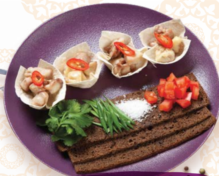
Костный мозг с гренками, зеленью и перчиком чили 200г