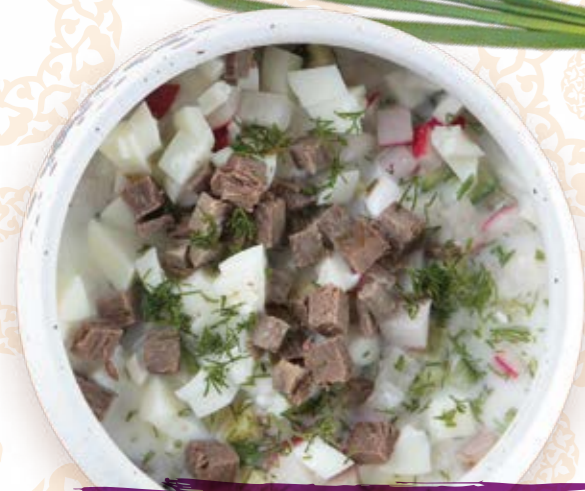
Окрошка на квасе/ на кефире 300г