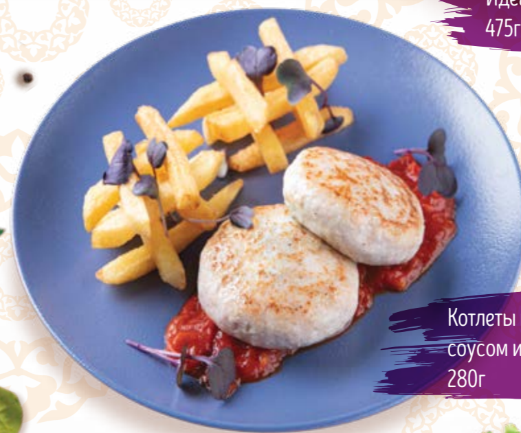
Котлеты из кролика с томатным соусом и картофелем фри 280г