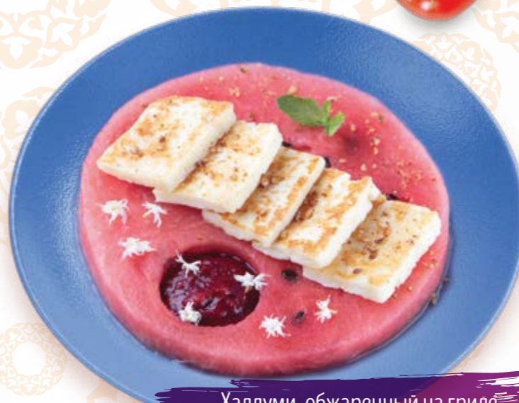
Халлуми, обжаренный на гриле, с арбузом и ягодным соусом 400г 485P