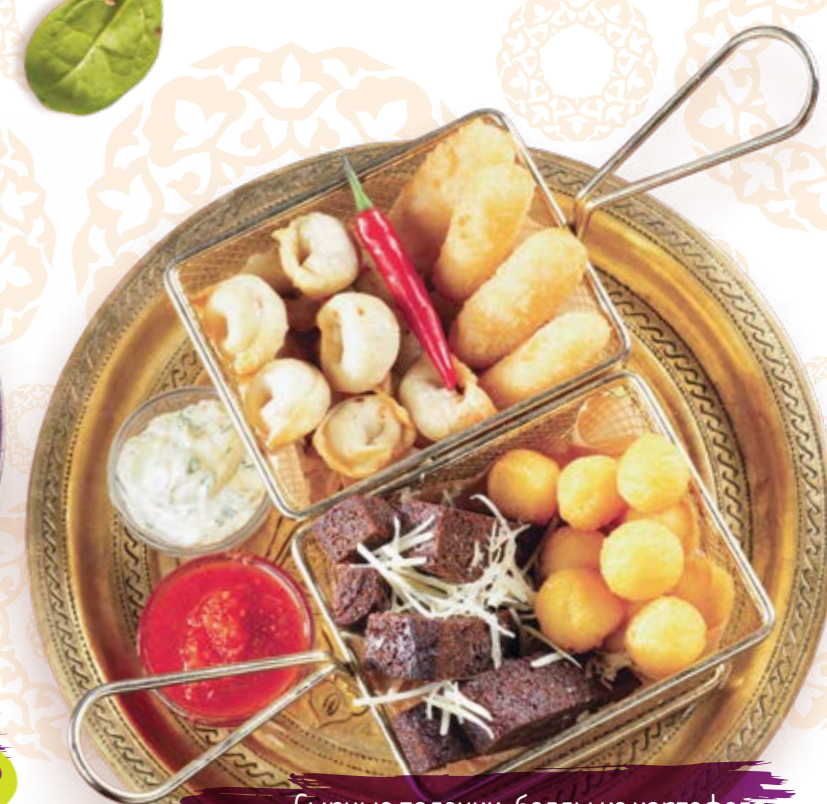
Сырные палочки, боллы из картофеля, гренки с сыром и жареные пельмени. Идеально к пенному 475г